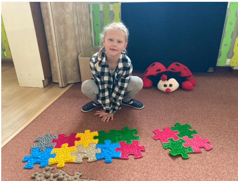
Slož obdélník, který má 10 dílků. Slož obrazec, který má 4 dílky.

Ortopedický chodník je velice vhodný pro témata jako jsou: v lese, na louce nebo jako jeden ze žvlů - Země.