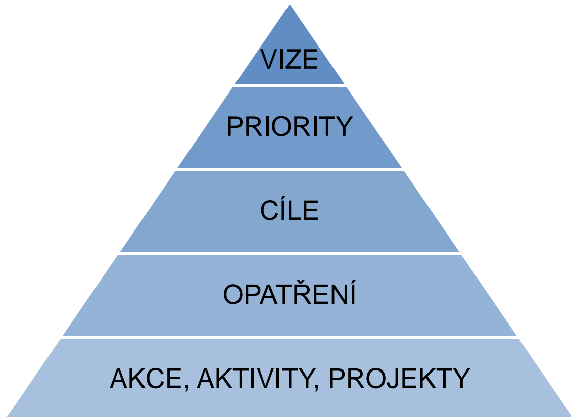
Obrázek 1: struktura strategie

Pro strategickou koncepci MAP je určující hierarchicky se rozpadající členění: vize – priority – cíle – opatření – aktivity. Strategický dokument MAP definuje potřebu a směry změn a rozvoje vzdělávání v regionu MAP. K dosažení Priorit MAP lze dospět realizací Opatření směřujících k jednotlivým Cílům.